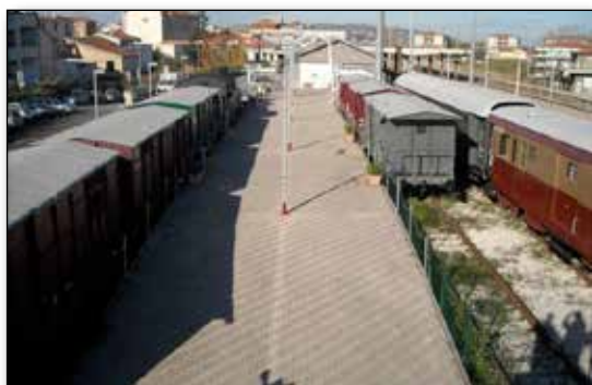
Rotabili museali appena risanati esteticamente