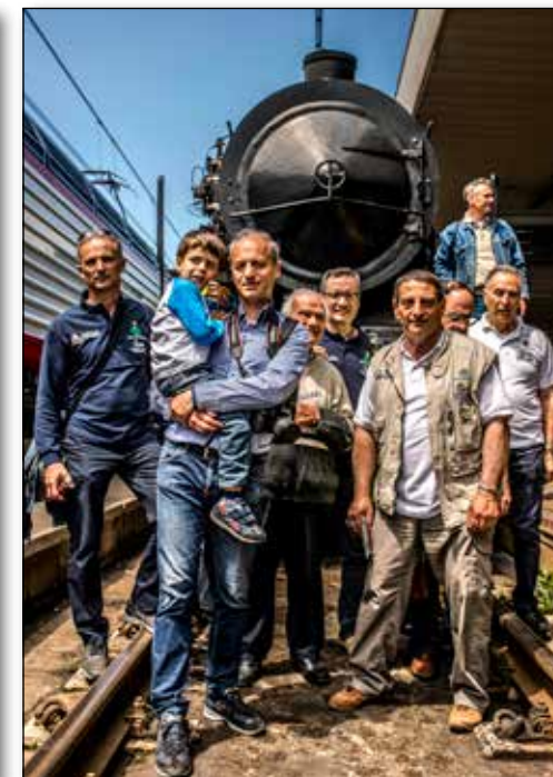
Pescara C.le 2013, arrivo del treno storico