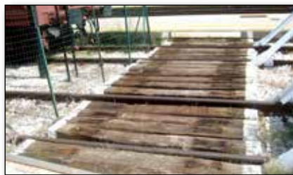
Attraversamento a raso di binari di stazione priva di sottopassaggio

A seguito di regolare istanza, il Settore Promozione Culturale della Giunta Regionale d'Abruzzo , ha classificato il museo ai sensi della L.R. 44/92 . La relativa determinazione dirigenziale è pubblicata nel numero del 22 maggio 2013 del Bollettino Ufficiale della Regione Abruzzo .