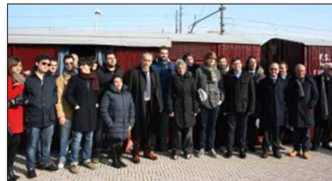
Giornata della Memoria 2013, al centro il Sottosegretario di Stato Giovanni Legnini

Ma la vera ambizione per Acaf , consiste nel perseguire l'obiettivo di far ricostruire in sito (area piano caricatore) una tettoia lignea , nello stile della datata tipologia dei fabbricati merci . Allo scopo di tutela al coperto dei rotabili museali e nell'intento di favorire la pubblica e gratuita disponibilità di un luogo da destinare ad auditorium, attività espositive, teatrali, musicali e socio-ricreative . La progettazione prevista dalla normativa delle opere pubbliche, a cura del Settore Lavori Pubblici del Comune di Montesilvano, è stata approvata dalla Giunta Municipale con deliberazione n.31 del 14 febbraio 2012, a seguito del rilascio di