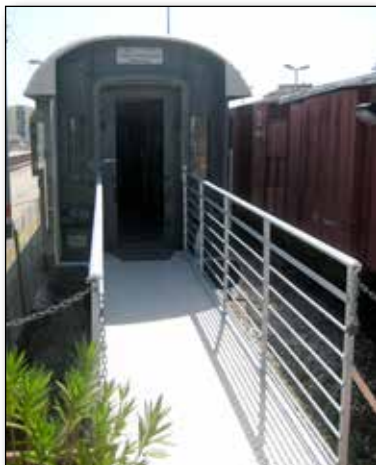
Ingresso alla scuola di ferromodellismo