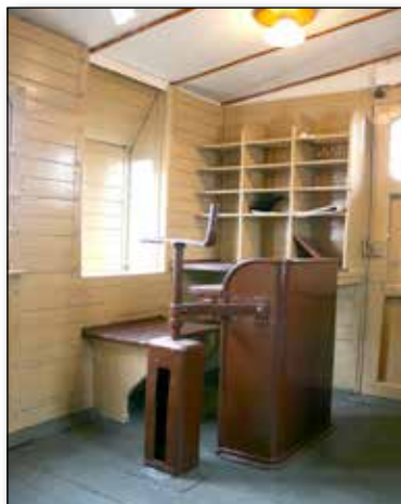
Scompartimento per capotreno