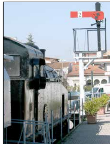
Segnale ad ala semaforica

nimento di locomotive a vapore dell'ex stazione (originariamente capolinea provvisorio) di Cansano (Aq);