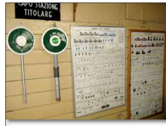
Segnali manuali di partenza e tabelle regolamentari