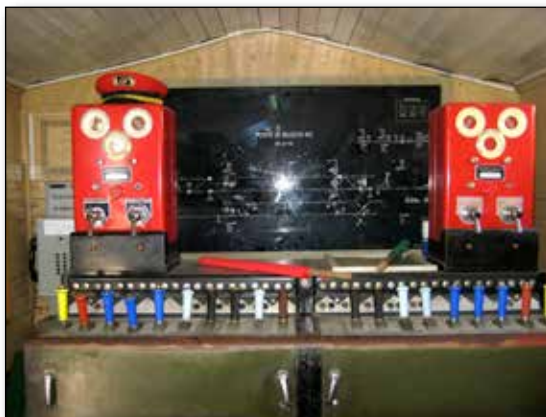
Banco A.C.E. di manovra per ufficio movimento

in viaggio. Nello stesso ambiente, risultano numerosi gli attrezzi e reperti storici dell'ex servizio lavori, compreso un ciclo-rotabile, artigianalmente motorizzato e all'epoca utilizzato da operai-cantonieri in linea , già in dotazione alla stazione FS di Pettorano sul Gizio (Aq).