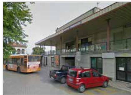
Stazione FS di Montesilvano