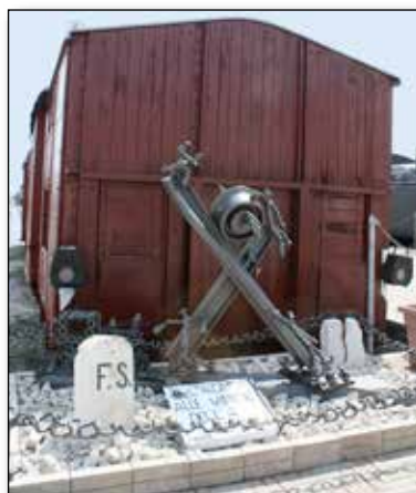
Monumento “alle vittime della rotaia”

Dopo anni di intenso lavoro di alcuni soci, con significative cerimonia pubblica e conferenza stampa, il “IL MUSEO DEL TRENO” è stato presentato ufficialmente alle Autorità, ai media ed alla Cittadinanza, in data 24 Aprile 2009.