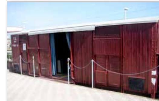
Vagone FS serie "F 1925"