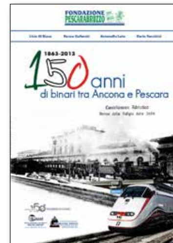
Copertina libro "150 anni di binari tra Ancona e Pescara"

Quale componente del Comitato per le celebrazioni del 150° anniversario della tratta Ancona-Pescara della ferrovia adriatica e del 50° anniversario della dismissione della ferrovia elettrica Pescara-Penne ( www.150ferroviadriatica.it ), insediatosi presso la Fondazione Pescarabruzzo , l' Acaf ha proposto e fatto condividere eventi celebrativi, quali: effettuazione di un treno didattico di Sangritana spa , un convoglio storico a vapore di Trenitalia spa trainato dalla locomotiva FS gr. 685.196 (con 8 vagoni rimorchiati), la pellicolatura di un autobus di linea di Gestione Trasporti