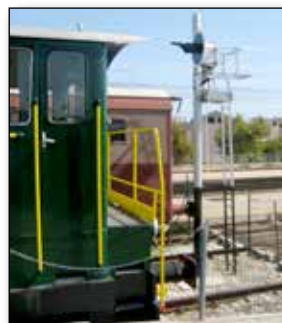
Segnale luminoso fisso a vela singola