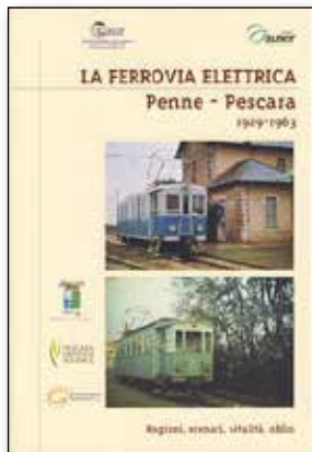
Copertina libro "La ferrovia elettrica Penne-Pescara"

Grazie al significativo e rilevante sostegno della Provincia di Pescara, nelle celebrazioni per l'80° della sua costituzione, della Gestione Trasporti Metropolitan spa, dei Comuni di Penne, Loreto Aprutino, Pianella, Collecorvino, Moscufo, Cappelle sul Tavo, Montesilvano, Pescara, della Banca di Credito Cooperativo in Cappelle sul Tavo, di alcuni operatori economici, con l'insostituibile concorso dell'Auser-area Saline (volontariato di pensionati aderenti al sindacato CGIL), l' Acaf è riuscita a perseguire un ambizioso progetto editoriale: la pubblicazione in 2200 copie del volume storiografico " La ferrovia elettrica Penne-Pescara 1929/1963 , ragioni, scenari, vitalità, oblio" (gratuitamente distribuito), promuovendo nove convegni pubblici di presentazione, tutti partecipati da numerosa e interessata Cittadinanza.