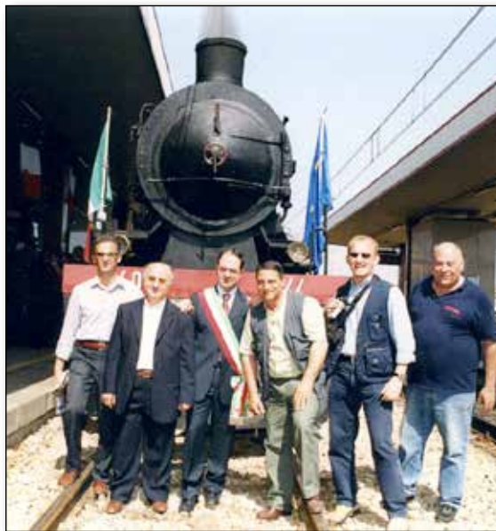
Montesilvano 2003, partenza del treno storico