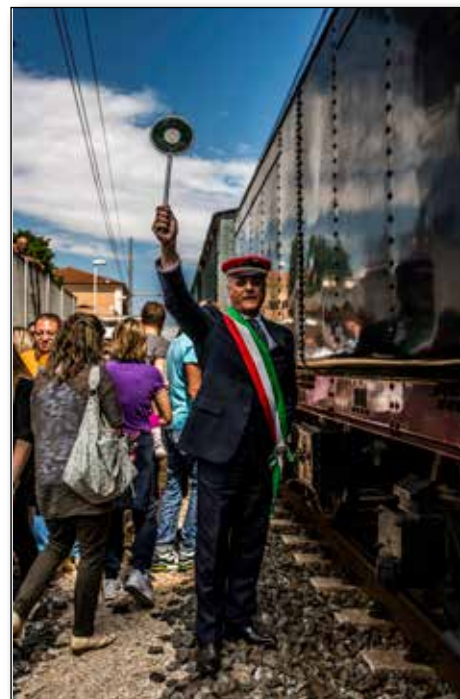
Pineto 2013, il Sindaco-Capostazione

L' Acaf non persegue fini di lucro e la relativa quota annua di iscrizione è stabilita in 30 Euro.