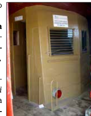
Cabina per guida simulata locomotore FS E 636