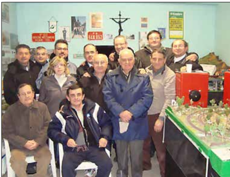
Alcuni soci ed amici Acaf in sede