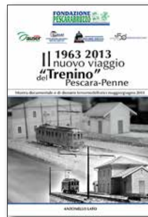
Opuscolo "Il nuovo viaggio del Trenino Pescara-Penne"

Metropolitan spa (azienda erede ex FEA) nei colori originali (1929) di un'elettromotrice in servizio tra Pescara e Penne, una mostra storico-ferroviaria con catalogo presso i locali della stessa Fondazione bancaria e la stampa del volume rievocativo " 150 anni di binari tra Ancona e Pescara ", gratuitamente distribuito. Tali eventi si sono svolti dal 10 al 12 maggio 2013. Il 20 giugno 2013 il suddetto autobus in livrea storica ha percorso la tratta originaria, sostando davanti alle ex stazioni e fermate ancora oggi esistenti ed accolto da numerosa Cittadinanza ed Autorità locali. Viaggio riservato a giornalisti ed ai soci Acaf , a cinquanta anni dall'ultima corsa del " Trenino di Penne ".