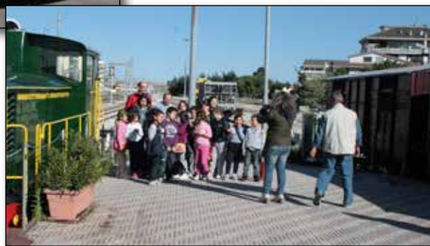
Visita di una scolaresca