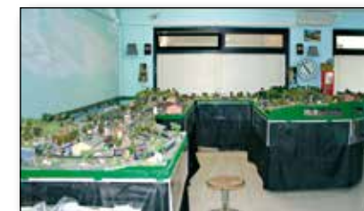
Area espositiva del plastico sociale

Dal 2006, l' Acaf cura l'organizzazione delle edizioni della “Borsa-scambio” e relativo concorso di modellismo ferroviario , che hanno riscosso notevole successo grazie alla numerosa presenza di visitatori. In tali circostanze sono state anche coniate apposite medaglie ricordo, per partecipanti all'evento e interessati di numismatica.