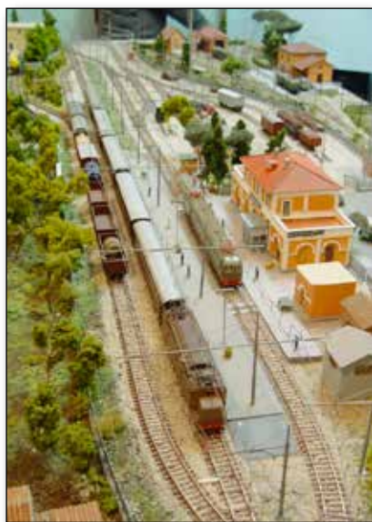
Diorama in scala 1:87 delle vecchie stazioni FS e FEA di Montesilvano