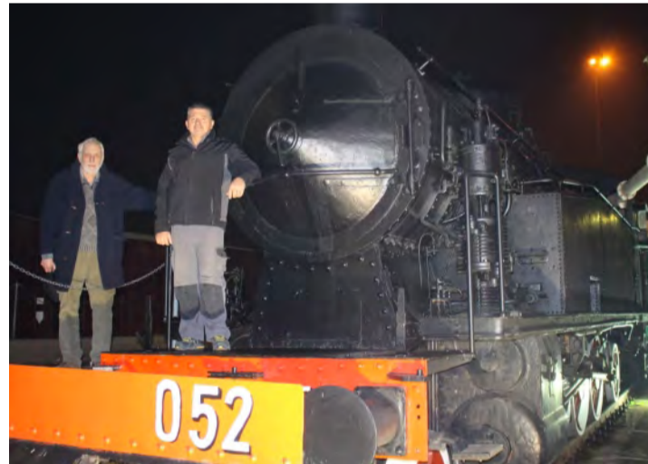
Illuminazione notturna per i 90 anni della prima locomotiva del Museo.