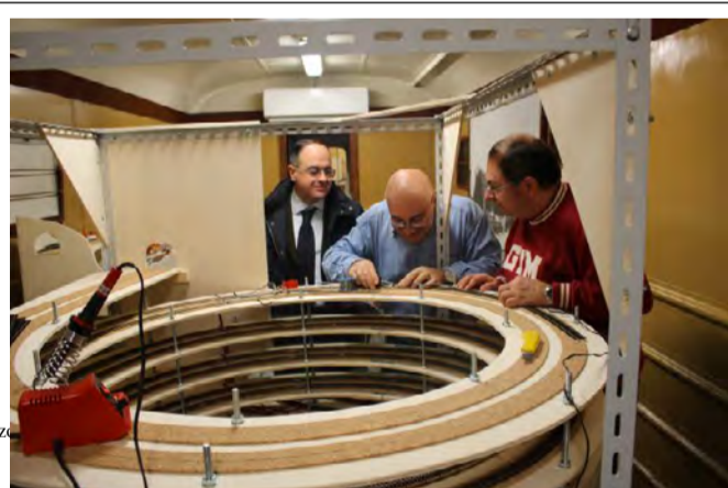
Il cantiere del nuovo plastico sociale in vettura "Scuola Regionale Fermodellismo"