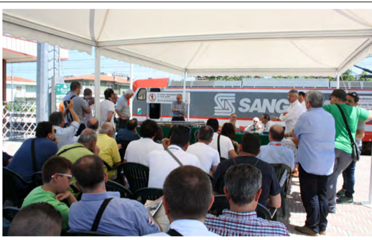
Giornate promozionali azienda fermodellistica A.C.M.E.