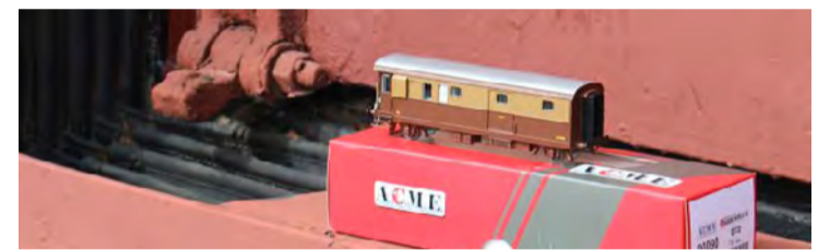
Modello di un bagagliaio del Museo.