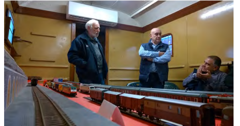
Work shop dell'azienda fermodellistica A.C.M.E.