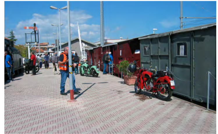
Motoraduno d'epoca al Museo.