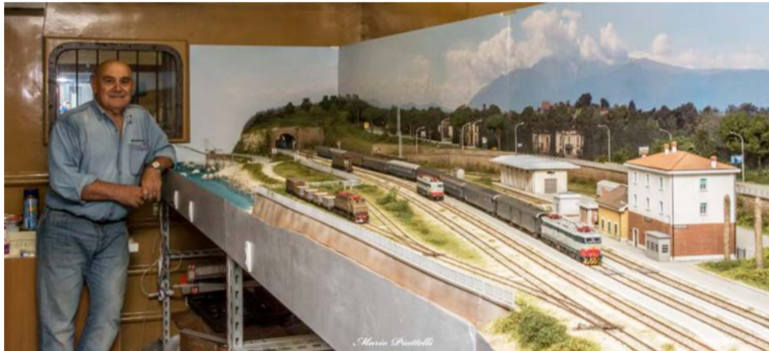
Cantiere del nuovo plastico sociale in vettura museale.