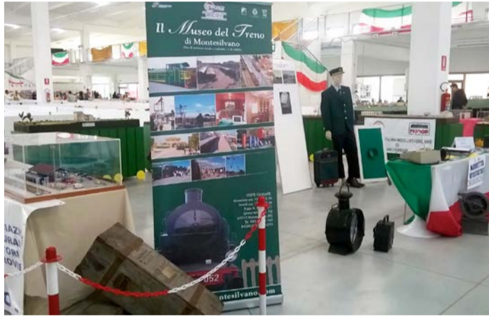
Mostra modellismo presso Camera di Commercio in Chieti.