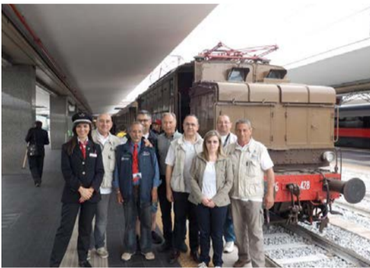
Viaggio e scorta al treno storico "Napoli-Portici"

Comunicazione finanziamento "TETTOIA-AUDITORIUM"