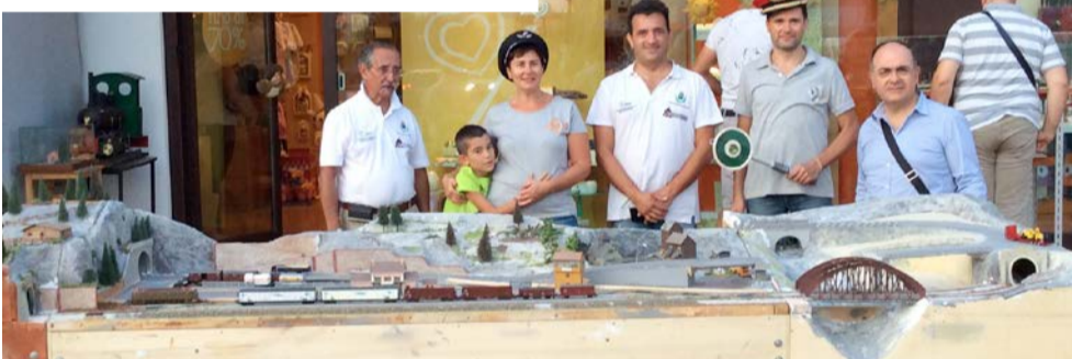
Attività promozionali in concorso con i commercianti del centro cittadino.