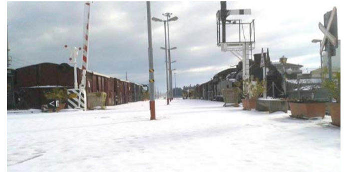
Sito museale innevato.