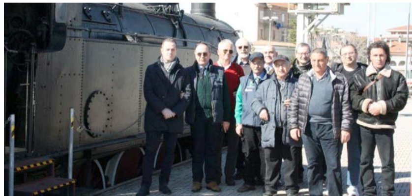
Visita del Presidente della Provincia di Pescara.