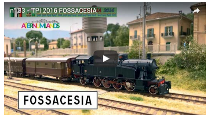
"Treno plastici d'Italia" 2016, viaggio on line - YouTube