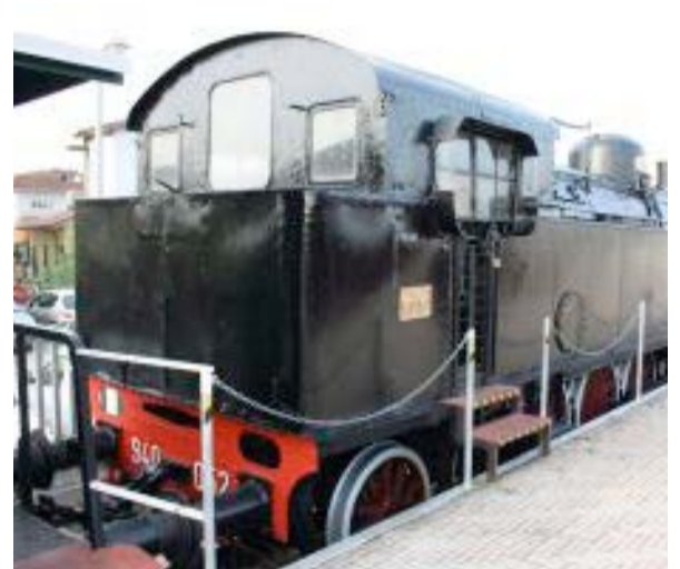
Restauro estetico appena concluso.

Comunicazione finanziamento "TETTOIA-AUDITORIUM"